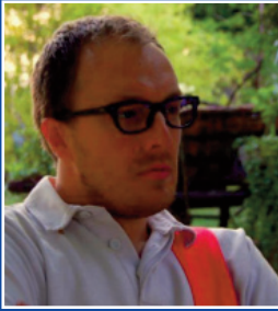
Autor: Jona Tibor