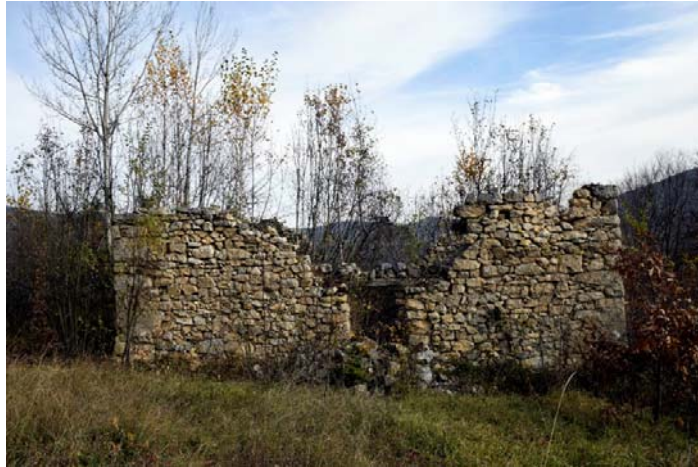
Ostaci džamije u selu Planjsko

Nakon svih ovih događaja i atmosfere straha, većina muslimanskog stanovništva pobjegla je iz Bukovice. Epilog događaja u Bukovici u periodu od 1992. do 1995. godine je sljedeći: ubijeno je šest osoba, 11 osoba bilo je kidnapovano i odvedeno u zatvor u Čajniče, kao posljedicu torture samoubistvo su izvršile dvije osobe, gotovo svo muško stanovništvo više puta je pretučeno, zapaljeno je najmanje osam kuća, a sva pokretna imovina opljačkana je, kuće devastirane i uništene. Raseljeno je oko 125 porodica sa 330 članova.