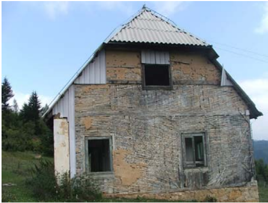
Osnovna škola Planjsko