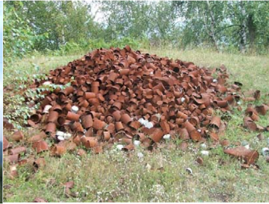
Ostaci limenih kutija od hrane poslije odlaska VJ

Pripadnici VJ skunuli su krov sa kuća u Bukovici i time pokrili vojnu karaulu. Sa svih kuća poskidane su cijele salonitne table jer su natkrivali stražarska mjesta i rovove. Zapaljeno je ukupno pet kuća.