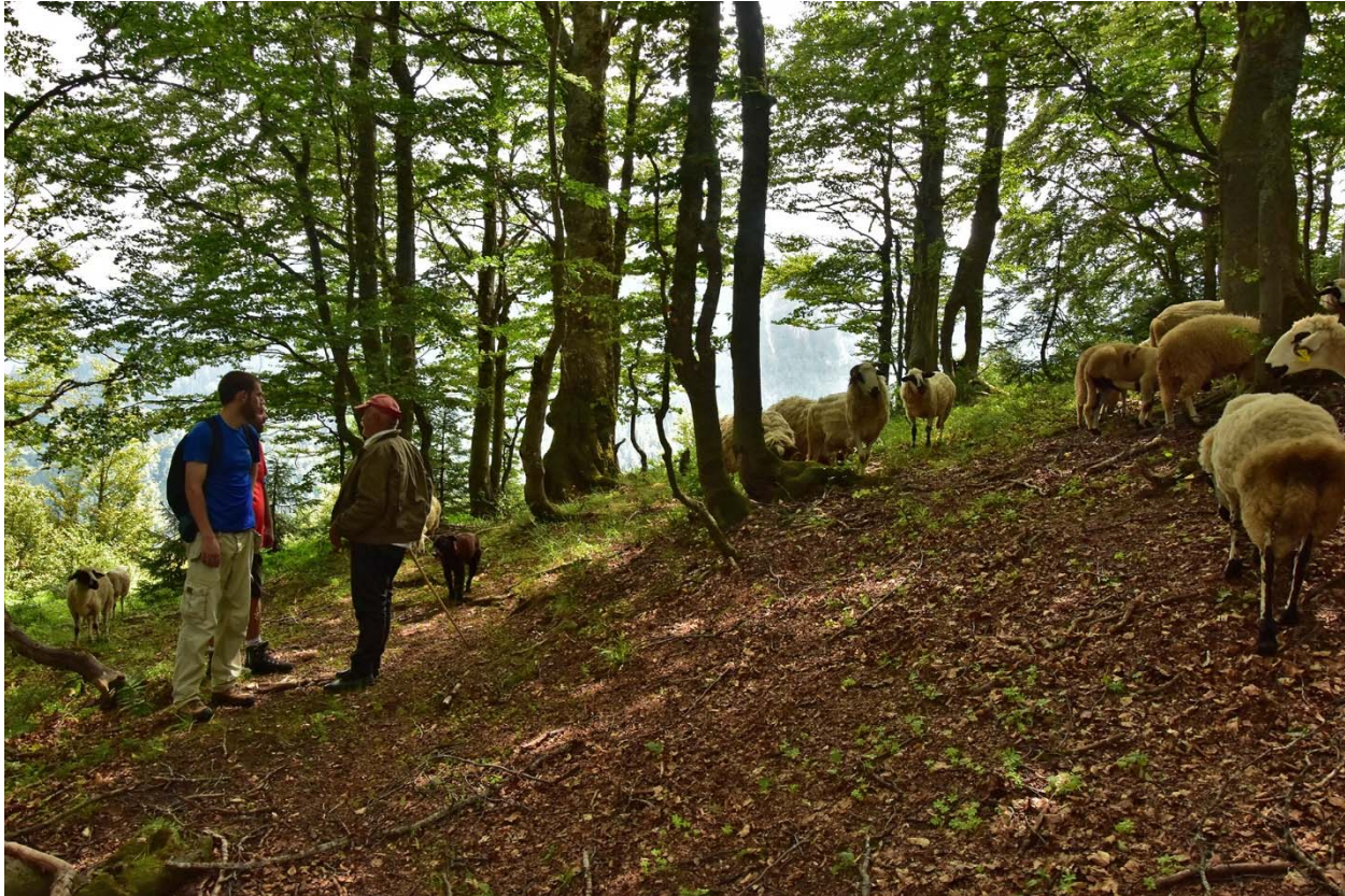
Fotografija 4. Ekipa iz CZIP-a razgovara sa lokalnim ljudima

I u Lovačkom Savezu Crne Gore, na osnovu raspoloživih podataka, bilježe prisustvo risa.