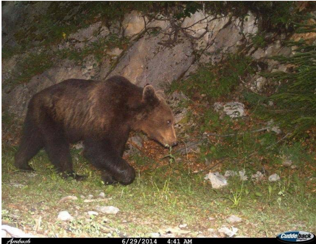
Fotografija 6. Rezultati kamera zamki.

S druge strane, iz Ministarstva poljoprivrede i Lovačkog Saveza CG, tvrde da se brojnost plemenite divljači povećava, iako nisu naveli na koji način su to utvrdili.