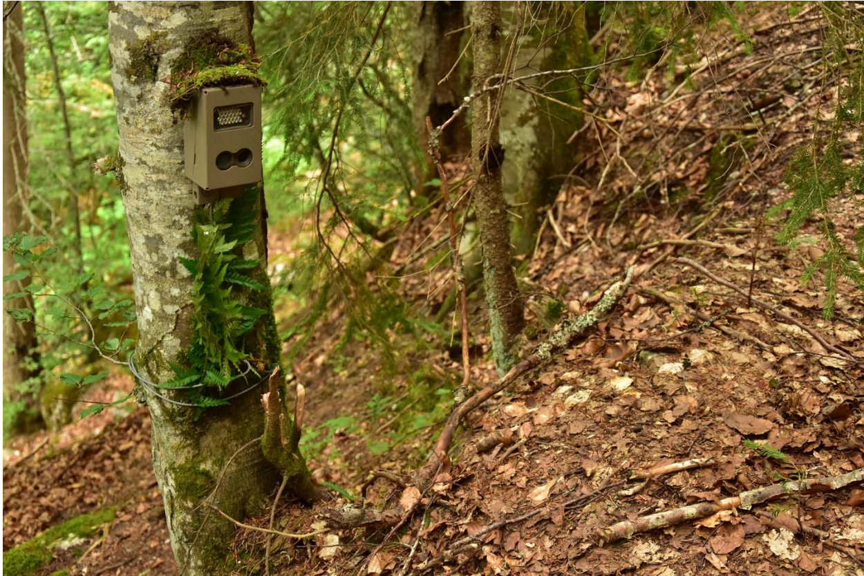
Fotografija 3. Kamera zamka pozicionirana za zabilježavanje blakanskog risa

Iz Direktorata za šumarstvo i lovstvo negiraju da je balkanski ris istrijebljen kod nas i kažu da se njihova staništa nalaze na Prokletijama i Hajli.